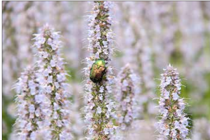
Foto: Ein schillernder Besucher auf Wanninchen's Wiesen: der Rosenkäfer bietet ein schönes Fotomotiv. ©Theresa Rieß/Naturpark Niederlausitzer Landrücken

Im Sommer stecken Wanninchen's Wiesen voller Leben – es summt, quakt und flattert. In der Ferienwoche werden spannende Experimente durchgeführt, die Wiese mit allen Sinnen erkundet, mit Naturmaterialien gebastelt und gemeinsam gekocht. Für die Teilnahme sind wet-