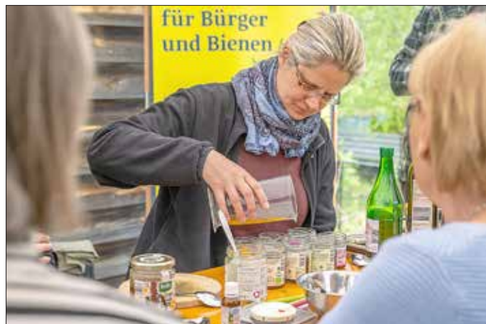
Kräuterkunde im Lerngarten: Beim Workshop „Küchenkräuter für die Hausapotheke“ wurde aus Honig, Essig und Kräutern ein Oxymel hergestellt.

Hinweis: Das Projekt „PartizipNatur“ wird aus Mitteln des Förderprogramms „Kommunale Modellvorhaben zur Umsetzung der ökologischen Nachhaltigkeitsziele in Strukturwandelregionen (KoMoNa)“ vom Bundesministerium für Umwelt, Naturschutz, nukleare Sicherheit und Verbraucherschutz und dem Land Brandenburg gefördert.