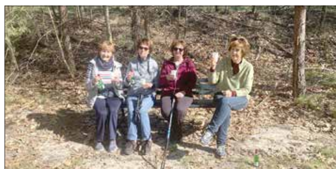
Freude auch bei der Laufgruppe