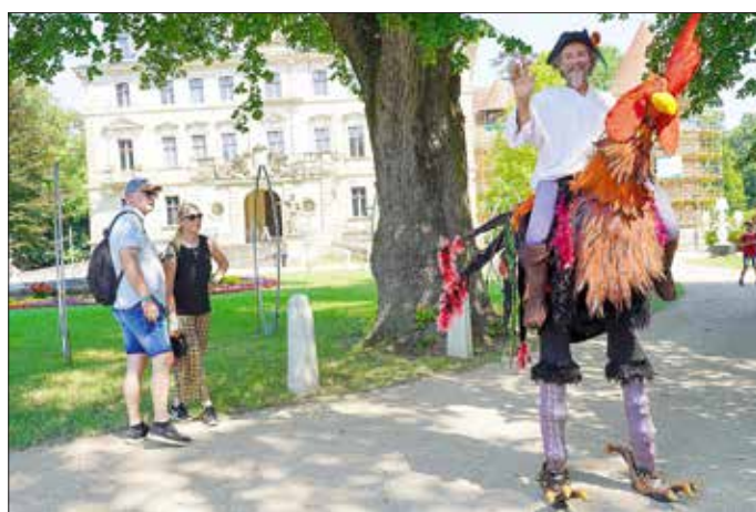
Archiv-Bilder von den Parksommerträumen 2024