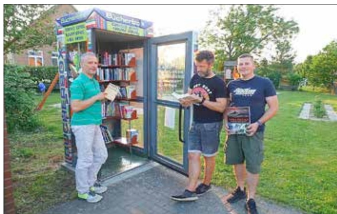
Der Ortsbeirat Koßwig

Mit dem Erwerb einer ehemaligen öffentlichen Telefonzelle, die mithilfe freiwilliger Helfer nach Koßwig transportiert wurde, ging es an die Umsetzung des Projektes. Das Fundament und die Aufstellung erfolgten zügig – leider musste man sich bei der grafischen Gestaltung der Zelle in Geduld üben. Als mit der Firma Piekorz Werbung aus Lübben ein Partner für die grafischen Ideen gefunden werden konnte, ließ sich auch dieser Schritt schnell realisieren, so dass die Beklebung der Bücherzelle rasch umgesetzt werden