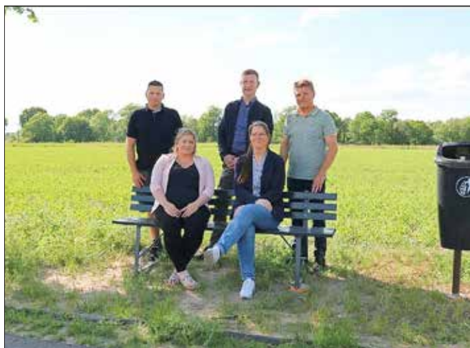
Übergabe der Sitzbänke

Im Ortsteil Koßwig konnte im Mai ein weiteres Projekt erfolgreich abgeschlossen werden: Am 19. Mai wurden zwei neue Sitzbänke an den Radwegen aus Richtung Belten und Vetschau nach Koßwig feierlich eingeweiht.