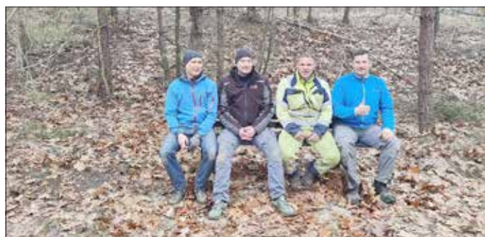
Die fleißigen Helfer