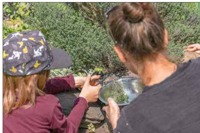
Die Kräuter wurden direkt im Lerngarten geerntet.