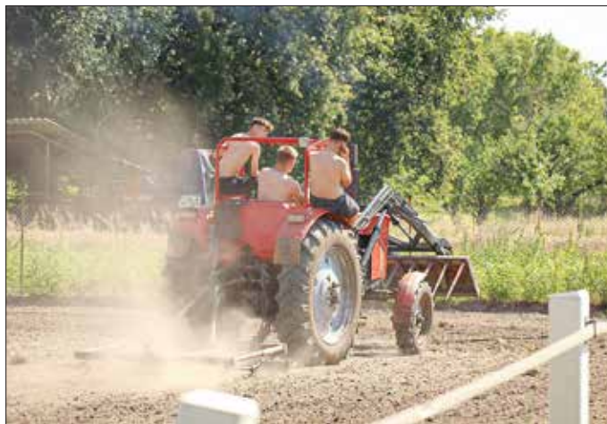
Eins der drei Siegerbilder vom Kreis-Erntefest Fotowettbewerb 2024 in Peickwitz.

Anlässlich des 3. Kreis-Erntefestes ruft der Landkreis Oberspreewald-Lausitz Hobbyfotografinnen und -fotografen zur Teilnahme am Fotowettbewerb unter dem Motto „Dorfkinder – überall zuhause“ auf. Gesucht werden kreative Motive aus dem Dorfleben – ob echte Dorfkin- der jeden Alters, Kuh & Kalb, großer Trecker & kleiner Trecker oder Erdbeerpflanzen mit Ableger. Der Fantasie kann freier Lauf gelassen werden, Motive finden sich sowohl in der Stadt als auch auf dem Land.