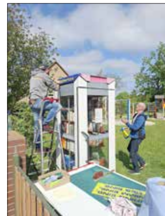
Die Telefonzelle wird zur Bücherzelle

geblich vorangetrieben hat. Mit der Bücherzelle wurde der Spielplatz in Koßwig um eine weitere Attraktion bereichert und der Ortsbeirat hat sie bereits getestet und