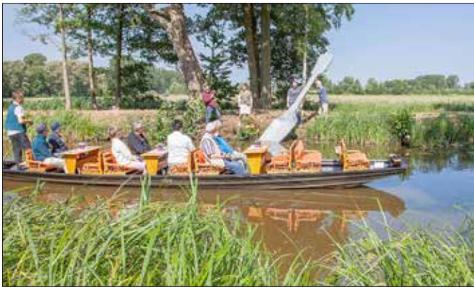
Aufstellung des Löffels 2018 an der Radduscher Kahnfahrt