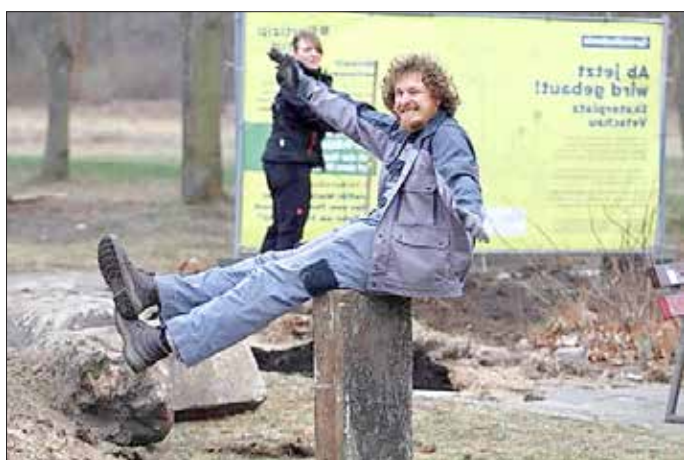
Mithelfen macht Spaß: Gute Laune und viel Engagement haben die Umgestaltung des Skaterplatzes geprägt.

Am Vormittag wird der neue Park offiziell eröffnet. Am Nachmittag laden wir alle Generationen zu Aktionen, Austausch und Begegnung ein.