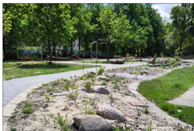
Das bunte Band wächst: Neben dem neuen Weg wächst langsam eine bunte Pracht aus rund 1.000 Stauden und Gehölzen sowie fast 3.000 Zwiebeln und Gräser.