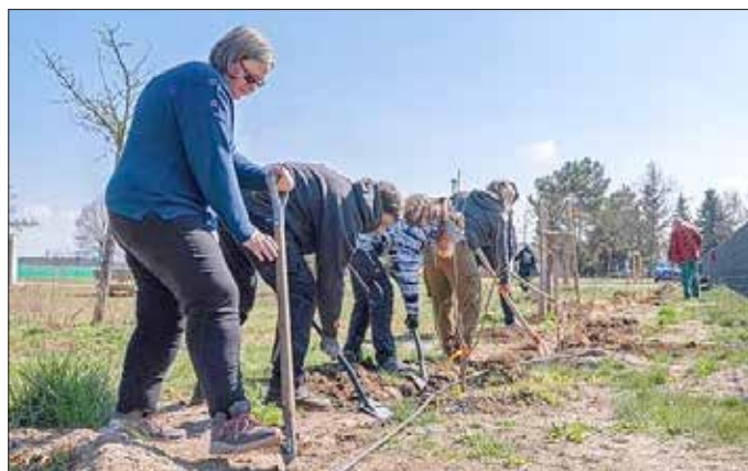
Wasser für die Neupflanzung: Im Rahmen eines Workshops wurden auf der Streuobstwiese in Missen viele Meter Tröpfchenbewässerung in den Boden gebracht. Dazu gab es viele Tipps und Informationen zur wassersparenden Bewässerung.

Hinweis: Das Projekt „PartizipNatur“ wird aus Mitteln des Förderprogramms „Kommunale Modellvorhaben zur Umsetzung der ökologischen Nachhaltigkeitsziele in Strukturwandelregionen (KoMoNa)“ vom Bundesministerium für Umwelt, Naturschutz, nukleare Sicherheit und Verbraucherschutz und dem Land Brandenburg gefördert.