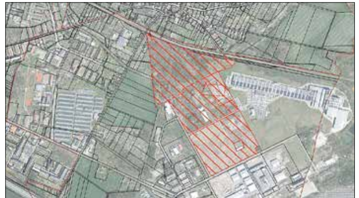
Darstellung Geltungsbereich im Luftbild