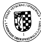
Bengt Kanzler Bürgermeister