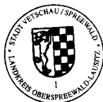
Bengt Kanzler Bürgermeister