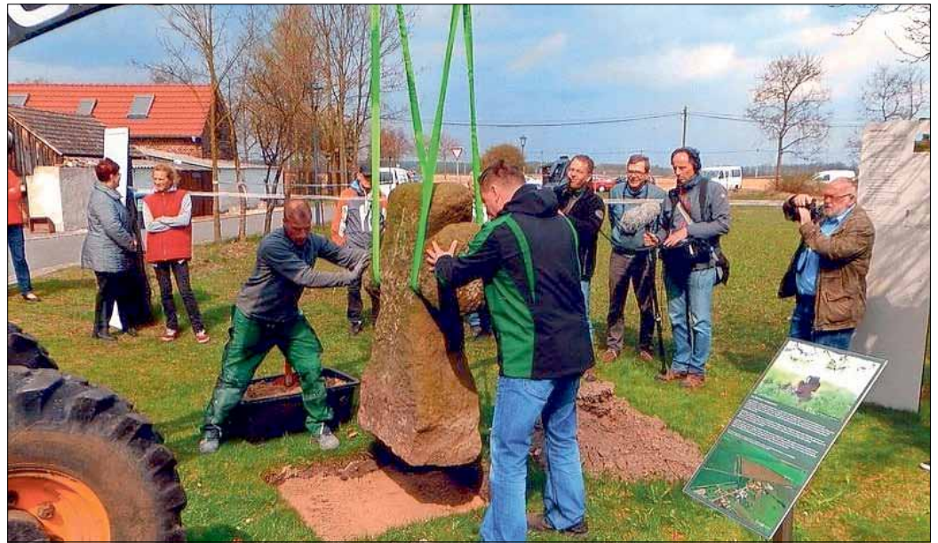
Aufstellung des Garrenchener Steinkreuzes im April 2016.