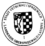
Bengt Kanzler Bürgermeister