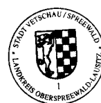
Bengt Kanzler Bürgermeister