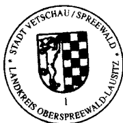
Bengt Kanzler Bürgermeister