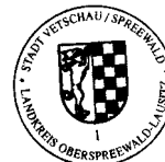
Bengt Kanzler Bürgermeister