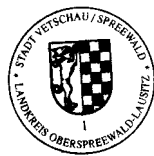
Bengt Kanzler Bürgermeister

Vorstehende 1. Nachtragshaushaltssatzung 2013 wurde mit ihren Bestandteilen und Anlagen dem Landrat des Landkreises Oberspreewald-Lausitz als allgemeine untere Landesbehörde angezeigt. In die 1. Nachtragshaushaltssatzung mit ihren Bestandteilen und Anlagen kann jedermann Einsicht nehmen während der Sprechzeiten der Stadtverwaltung Vetschau, 03226 Vetschau/Spreewald, Schloßstraße 10, Zimmer 303/304.